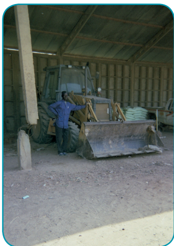
Photo : Pour la réalisation des mini-réhabilitations des collaborations importantes ont eu lieu avec l'ON pour porter un regard technique sur les projets de mini-réhabilitation ainsi que pour l'exécution de certains travaux.