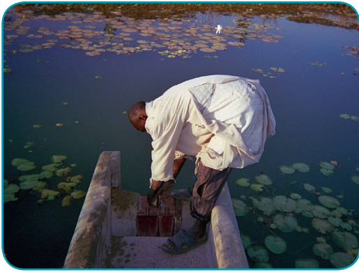
Photo : Aiguadier manipulant une prise tertiaire. La démarche ASIrri permet d'améliorer les relations entre les OERT et les aiguadiers de l'Office du Niger.

Dans le cadre du projet pilote de Molodo, plusieurs acteurs furent impliqués.