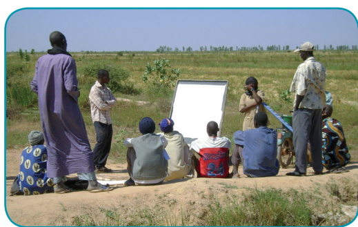
Photo : Collaboration avec un expert de l'IER pour la réalisation d'une formation sur le terrain. Le CPS peut mobiliser des prestataires extérieurs pour ainsi démultiplier sa force de frappe.

L'établissement des relations de confiance a permis au CPS de gagner en légitimité. Mais la FCPS doit continuer de négocier son positionnement.