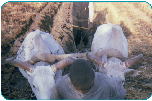
Photo : La disponibilité ou non d'équipements de travail du sol est un élément important à prendre en compte lorsque l'on discute de planification agricole.

■ Si le diagnostic agro-socio-économique révèle qu'un groupe de producteurs veut toujours planter une variété précoce, alors qu'un autre groupe préfère une variété à cycle plus long. Quelle planification collective permettra de concilier les intérêts de ces deux groupes tout en satisfaisant aux contraintes collectives ?