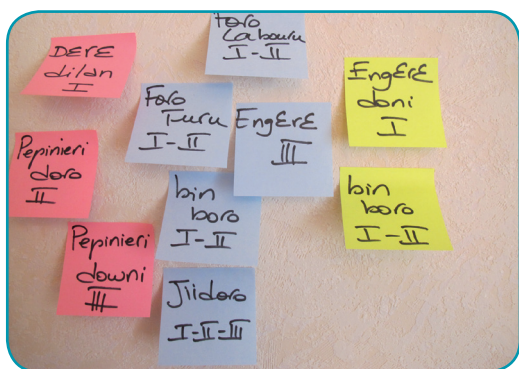
Photo : Exemple de fiches cartonnées pour un exercice de planification agricole concertée (mois mai à août pour une OERT du village de Niaminani).